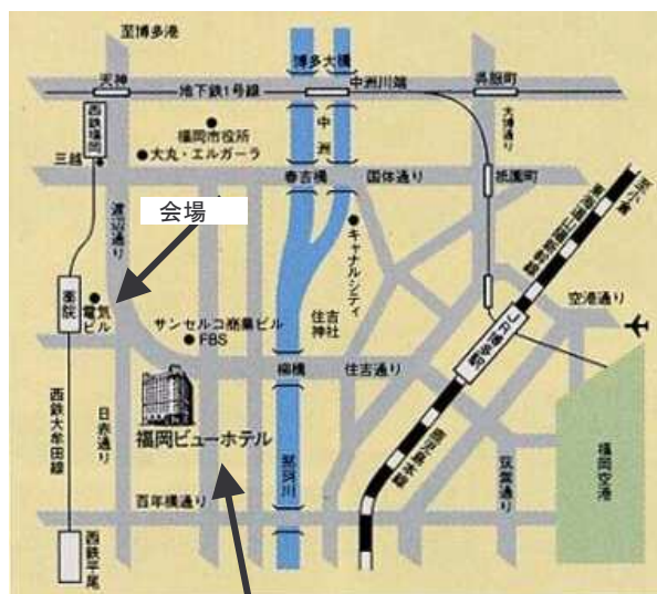
集合場所・福岡ビューホテル http://www.f-view.co.jp/